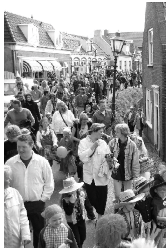
De optocht op Koninginnedag (Richard Gorter)

In afwachting van de optocht lezen we in het HD dat er 'Geen kaalslag bij buslijnen' plaatsvindt, maar dat alleen bus 14 naar Spaarndam absoluut wordt opgeheven. Aan het woord is de VVD-gedeputeerde Cornelis Mooij. De indruk is dat het gebruik van lijn 14 het laatste jaar juist toeneemt en dat er een behoorlijke bezetting is.