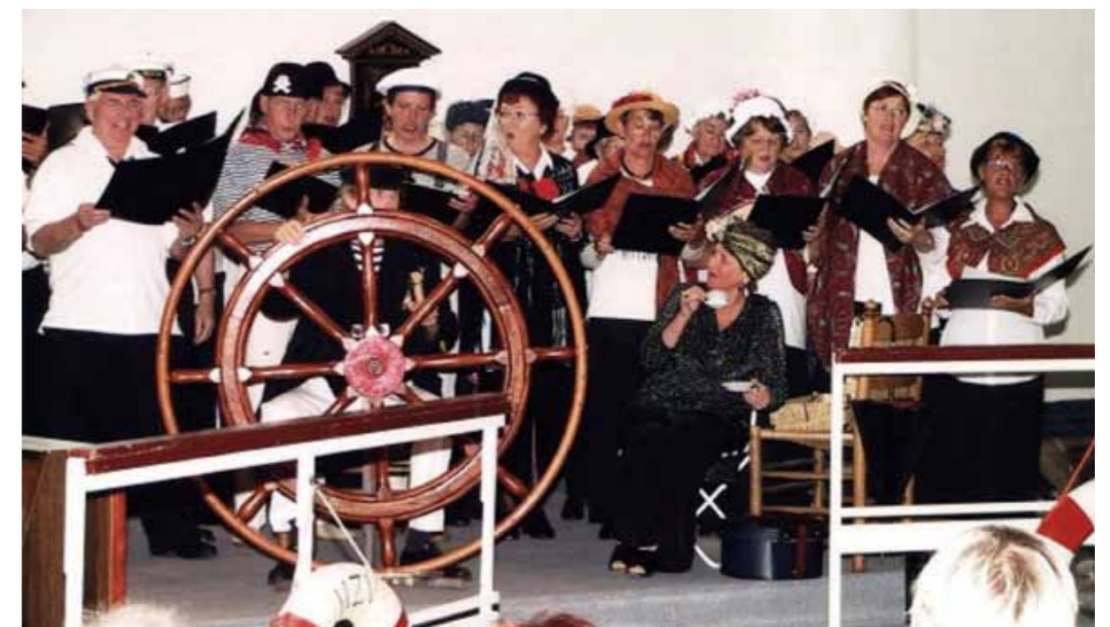
Een fragment uit de opvoering van de schipbreuk in 2002