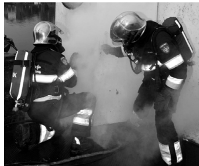
Inzet oefening De Rietpol

Na het opruimen van de spullen werd de oefening geëvalueerd, waarbij de goede punten alsmede de verbeterpunten van de oefening werd besproken.