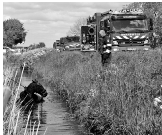
Paard te water

Op zaterdagmiddag raakte een ruiter met haar paard te water langs de Kerkweg in Spaarndam. Gelukkig kon de ruiter zelf uit het water komen, voor het paard moest de brandweer echter ter plaatse komen. Met behulp van vele handjes en een brandslang stond het paard na een klein halfuur weer in het weiland.